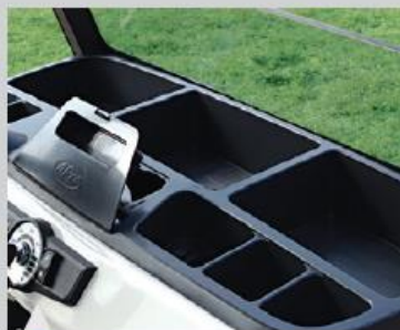
12 전면부 다양한 수납공간