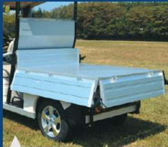
최대 사이즈의 적재함 및 3면 개방 기능