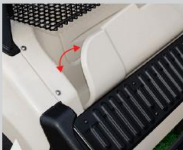
11 다목적 후면 사물함