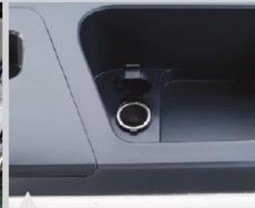
4 차량용 12V 충전잭