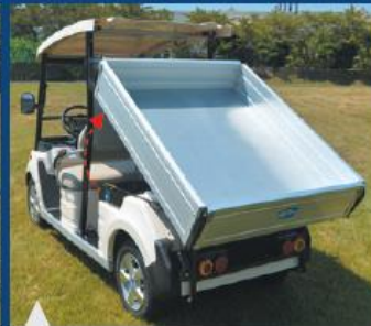
작업성이 뛰어난 롱데크 톨딩 기능