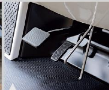
10 미끄럼 방지 및 악셀레이터 오작동 방지 Bar