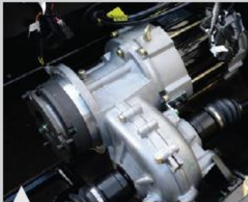
1 동급최대출력모터 장착(AC/4.6kw)

Specificity APRO의 다양한 편리성은 특별함과 즐거움을 선사합니다.