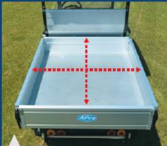
최대 사이즈의 롱데크 적재함