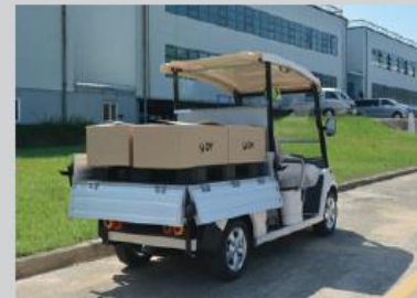
연구기관 / 학교