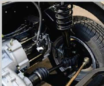
7 맥퍼슨 타입의 서스펜션 채용