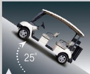
8 동급 최강의 오르막 등판능력