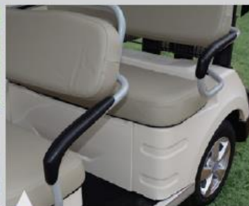
13 운전자를 배려한 낮은각도의 팔걸이