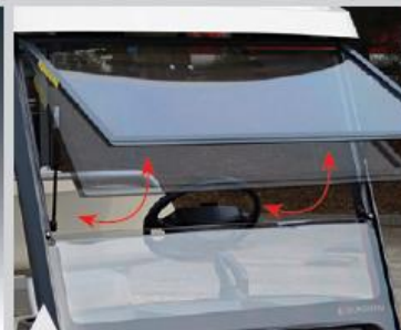
9 2분할방식 하부 개폐식 윈도우실드