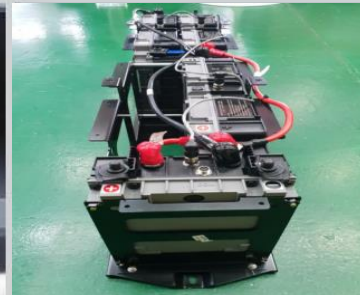
5 삼성 SDI 리튬배터리