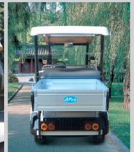
공원 / 리조트 / 펜션