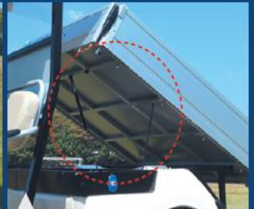
톨딩 닫힘 방지 스톱퍼