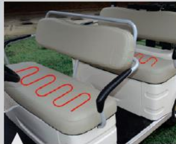
3 앞/뒤 좌석 열선시트 채용