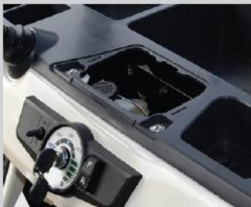
6 점검 편의성을 극대화한 점검구