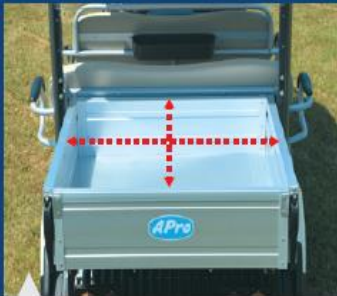
이동성과 적재가 편리한 숏데크 적재함