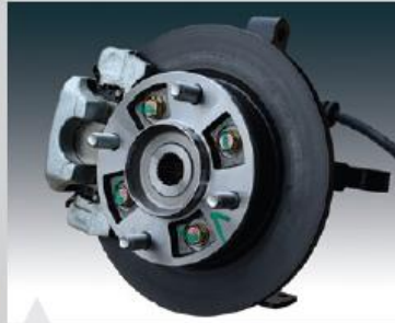
2 4륜 유압식 디스크 브레이크 채용